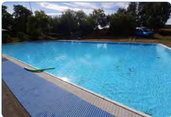
Das Schwimmbecken lag morgens noch ruhig in den ersten Sonnenstrahlen. Mittags waren die Kinder kaum noch aus dem Wasser zu bekommen.

Die Anlage bot Möglichkeiten für Hallensportarten, auf einer großen Wiese konnten viele Outdooraktivitäten getestet werden und auch die Beachvolleyballanlage sowie das Schwimmbecken wurden rege genutzt. Der Morgen war noch kalt und ließ ein wenig Bedauern bei den Schwimmern aufkommen. Um die Mittagszeit waren jedoch viele Kinder bei strahlendem Sonnenschein im Wasser.