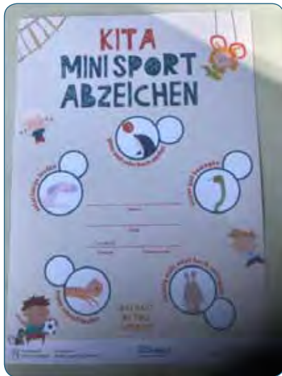
Die Urkunde für ein erfolgreich absolviertes KiTa-Minisportabzeichen