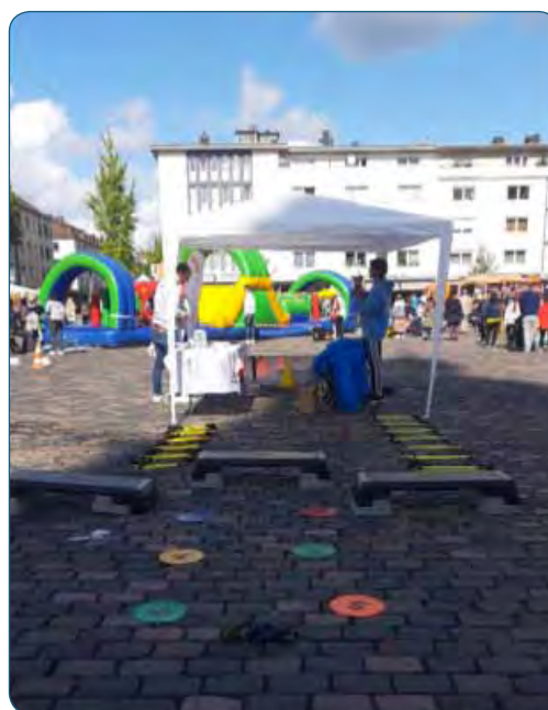
SSB Bewegungsparcours beim Kinderfest

Auch der SSB hatte sich beteiligt. Hier wurden die Besuchenden über die Projekte und Sportangebote des SSB informiert. Außerdem war ein sportlicher Parcours auf dem Marktplatz aufgebaut, der rege durch die Kinder genutzt wurde.