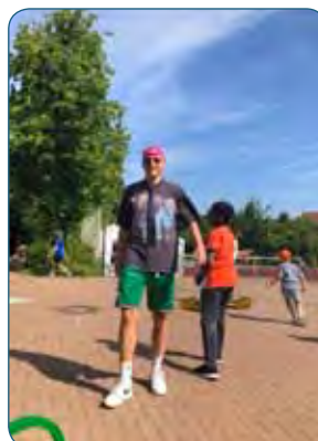
Sommerferienaktion am Haus des Sports

In der letzten Ferienwoche gab es für 10 bis 14jährige in der Turnhalle des Gymnasiums Gartenstraße und dem angrenzten Campuspark viele Angebote an Bewegung, Spiel und Spaß. Auch ein Mittagessen für die Jugendlichen war dabei.