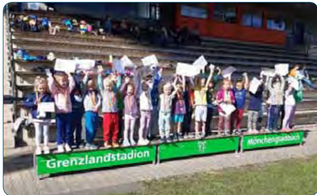
Eine KiTa bei der Siegerehrung

Am 16. September hatte der SSB in Zusammenarbeit mit den Fachbereichen Schule und Sport sowie Kinder, Jugend und Familie der Verwaltung einen Tag für das KiTa-Minisportabzeichen organisiert.