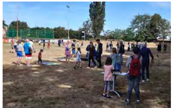
Die GHTC-Anlage bot vielfältige Möglichkeiten zum Ausprobieren von verschiedenen Sportangeboten

Am 21. August trafen knapp 200 Kinder auf eine Auswahl an Sportvereine auf der Anlage des Gladbacher Hockey- und Tennisclub (GHTC), um beim Aktionstag „Finde dein Talent im Sport“ unterschiedliche Sportarten auszuprobieren.